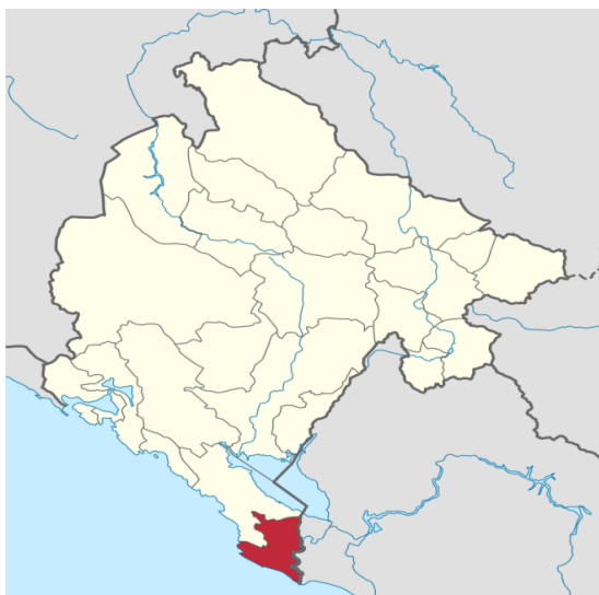
Slika 1. Geografski položaj opštine Ulcinj