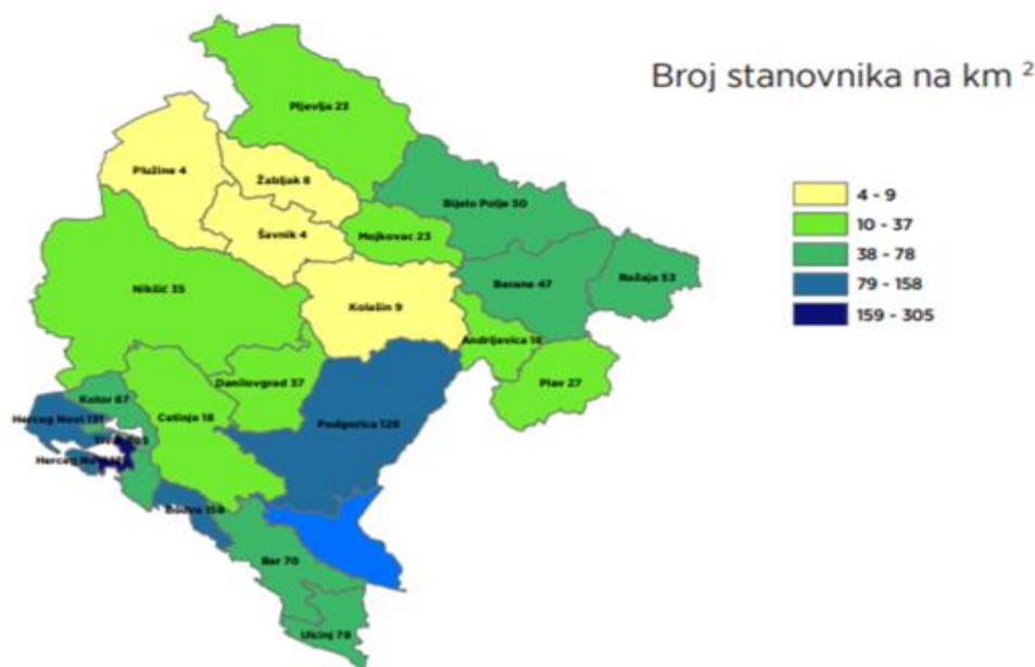
Foto 2. Dendësia e popullsisë sipas komunave në vitin 2011

Sipas regjistrimit të fundit, dendësia e popullsisë në Ulqin është 78,1 banorë/km 2 . Megjithatë, ende është mbi mesataren në Mal të Zi (44.9 st/km 2 ).