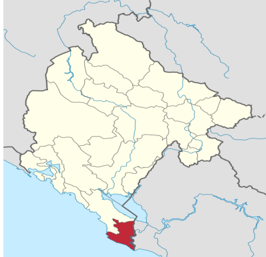
Foto 1. Pozita gjeografike e komunës së Ulqinit

Komuna e Ulqinit ka një peizazh dhe biodiversitet specifik dhe unik në Mal të Zi, i përbërë nga Plazhi i Madh me duna ranore dhe bimë halofitike, kënetat, Buna, kriporja, liqeni i Shasit, Valdanosi dhe ullishtat e tij shekullore.